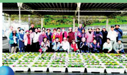
花いっぱい運動 (環境美化運動)