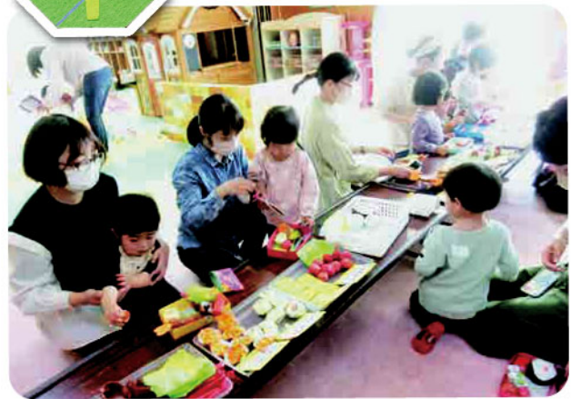
お弁当屋さんごっこ