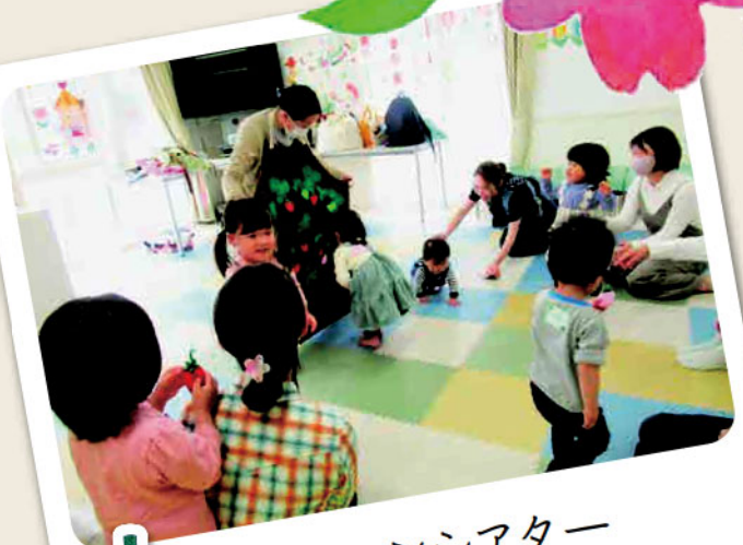
エプロンシアター