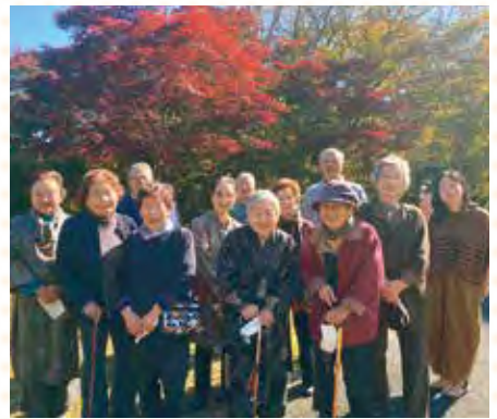
※写真撮影の為マスクを外しています。

快晴に恵まれたこの日、12名の方が参加し車窓から水沼ダムや花園神社の紅葉を楽しみました。途中花園モールで休憩を取り、写真を撮りをパチリ!