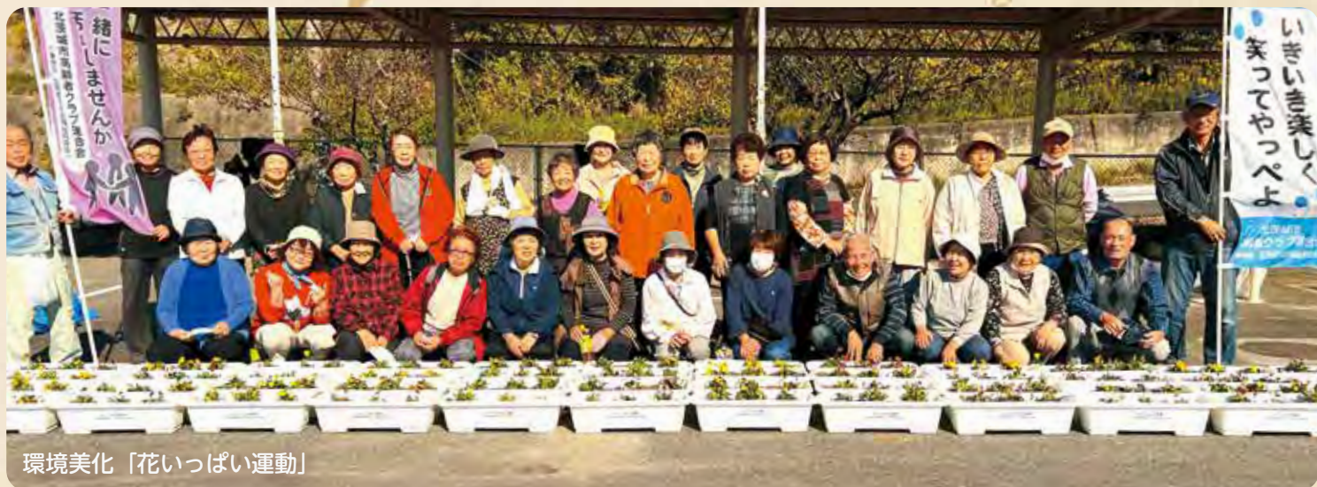
環境美化「花いっぱい運動」